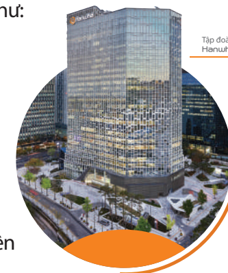
Tập đoàn Hanwha