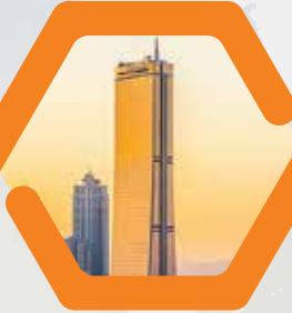
Hanwha Life Insurance