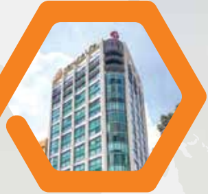
Hanwha Life Việt Nam