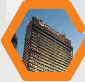
Tập đoàn Hanwha