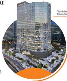
Tập đoàn Hanwha