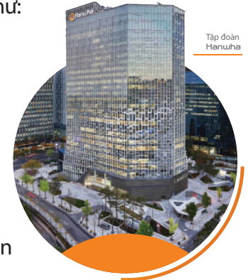
Tập đoàn Hanwha